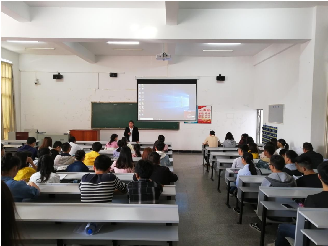
普洱景迈柏联普洱茶庄园有限公司 专场招聘会

招聘会开始，公司的工作人员向同学们介绍了该公司的主营业务，公司发展理念和情况，随后，向同学们介绍了所要招聘的岗位，并对岗位职责，任聘资格，工资待遇等方面做了说明，招聘期间，同学们积极向工作人员提问咨询，并有三分之一同学提交了个人简历和求职意向表。