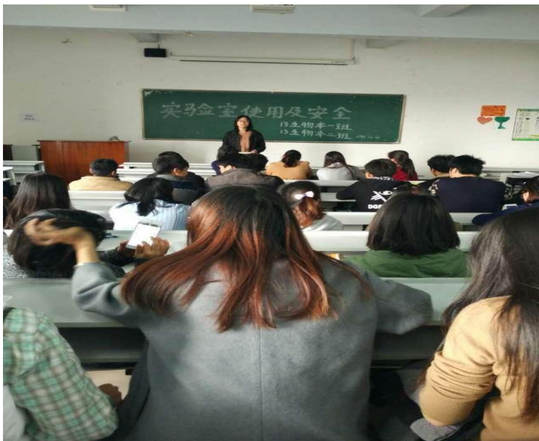
13 生物本 1、2 班班会现场