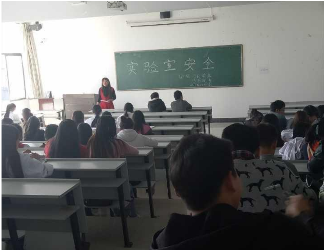
13 化学本、16 药技专班会现场