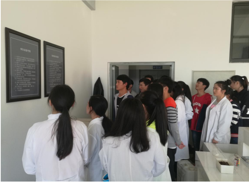
15 食安本 1 班班会现场