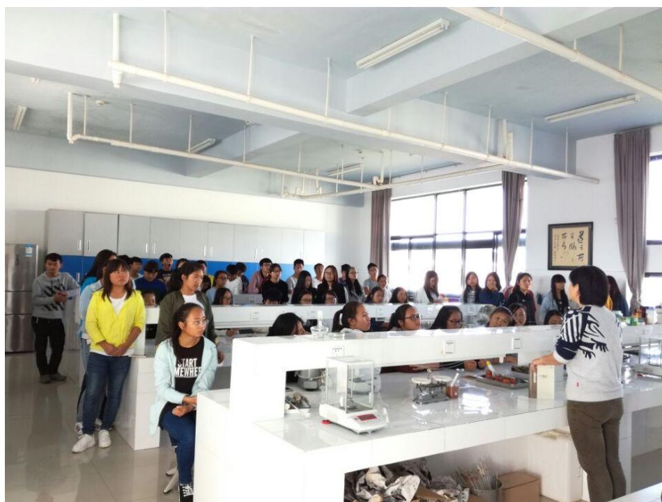
16 生物本、16 生物专班会现场