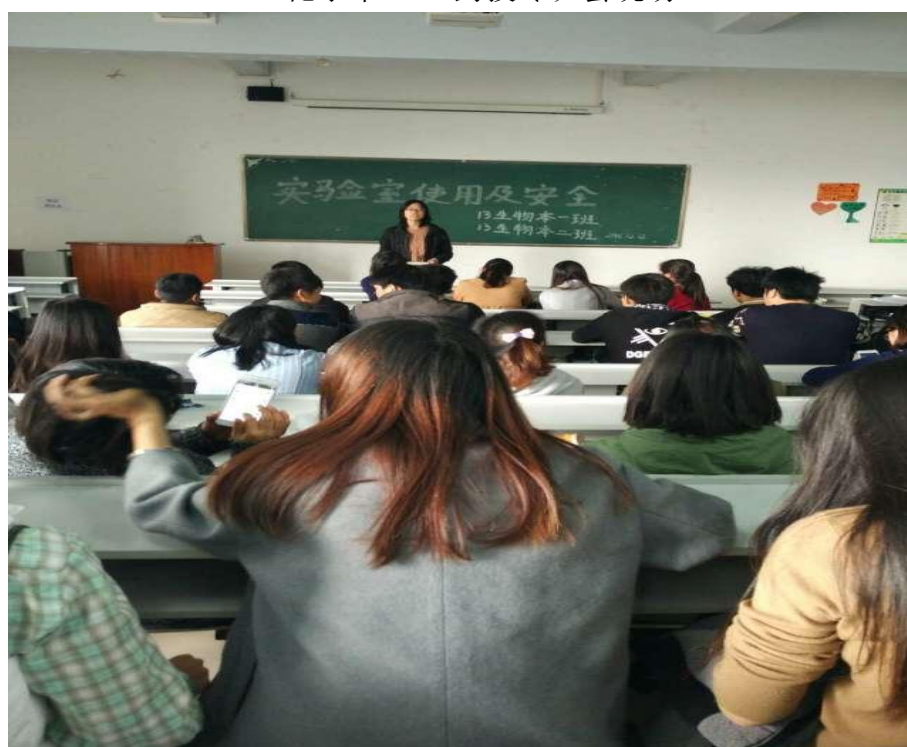
13 生物本 1、2 班班会现场