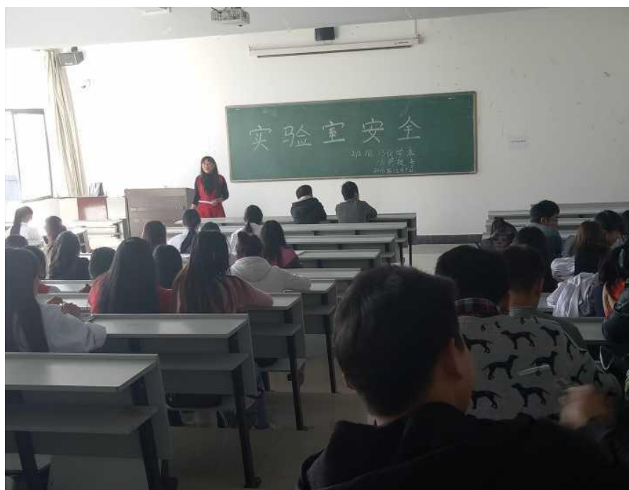
13 化学本、16 药技专班会现场