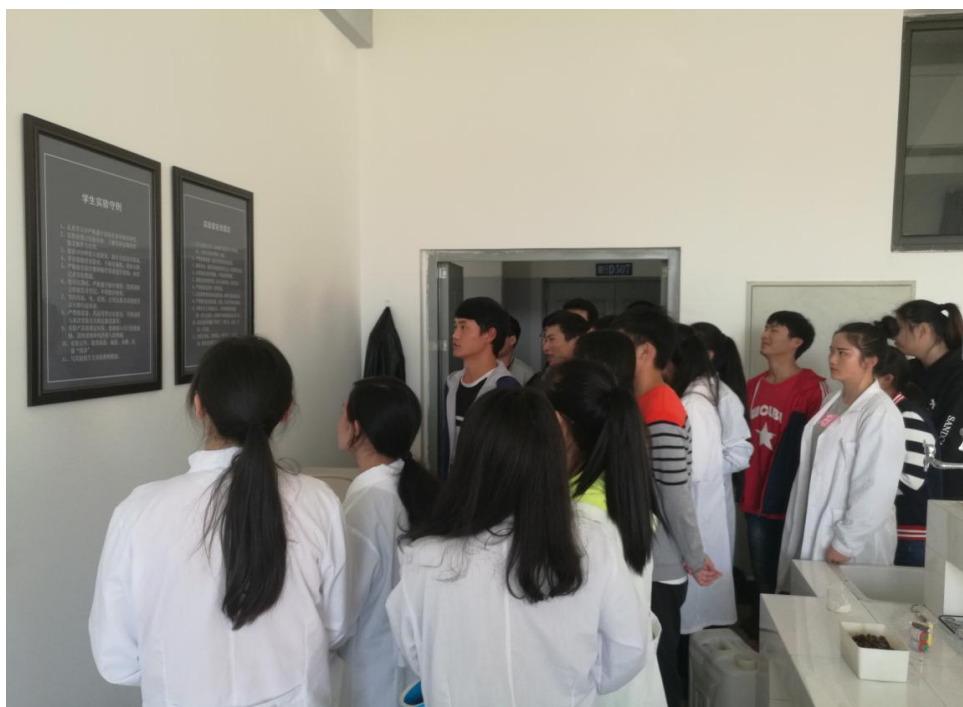
15 食安本 1 班班会现场