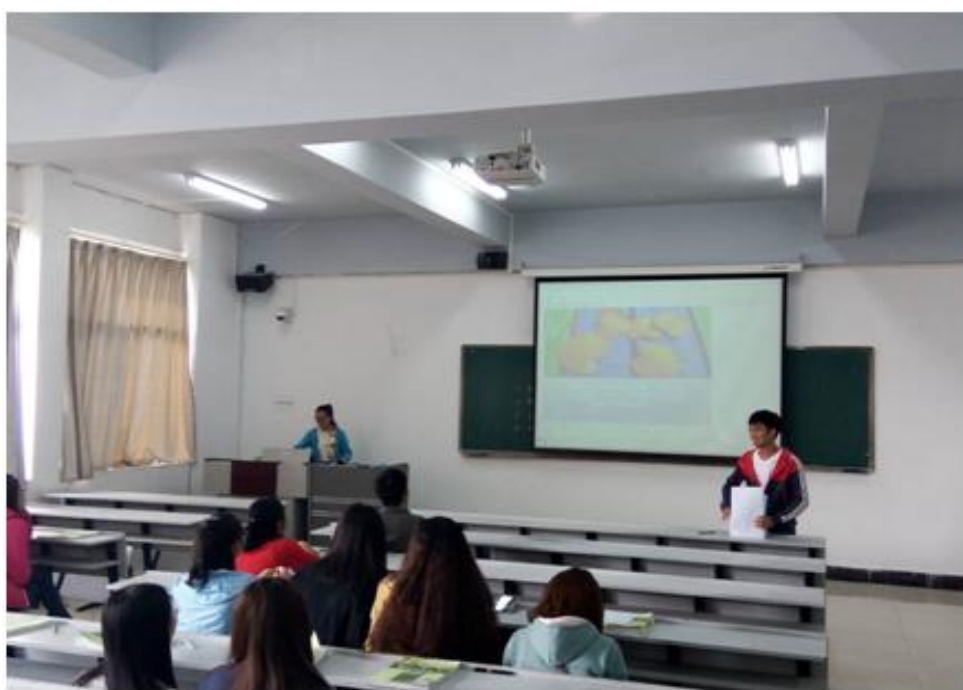
15 食安本 2 班班会现场