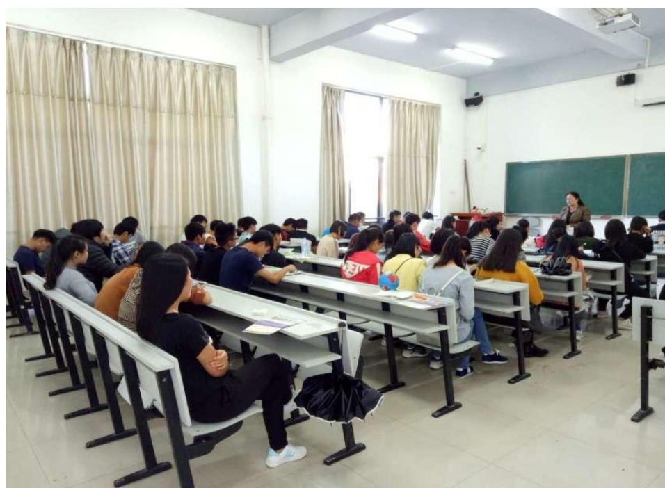
15 生物专、15 生物本 1、2 班班会现场