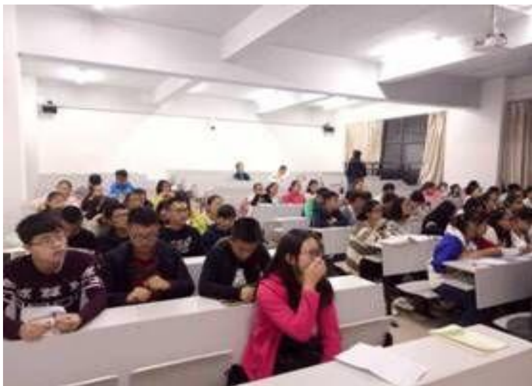
16 食安本 2 班班会现场