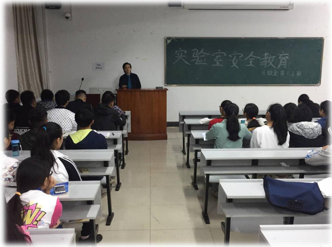
16 食安本 1 班班会现场