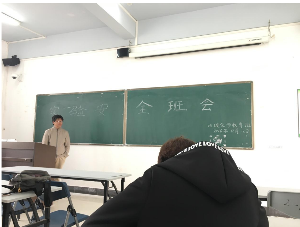
15 级化学专班会现场