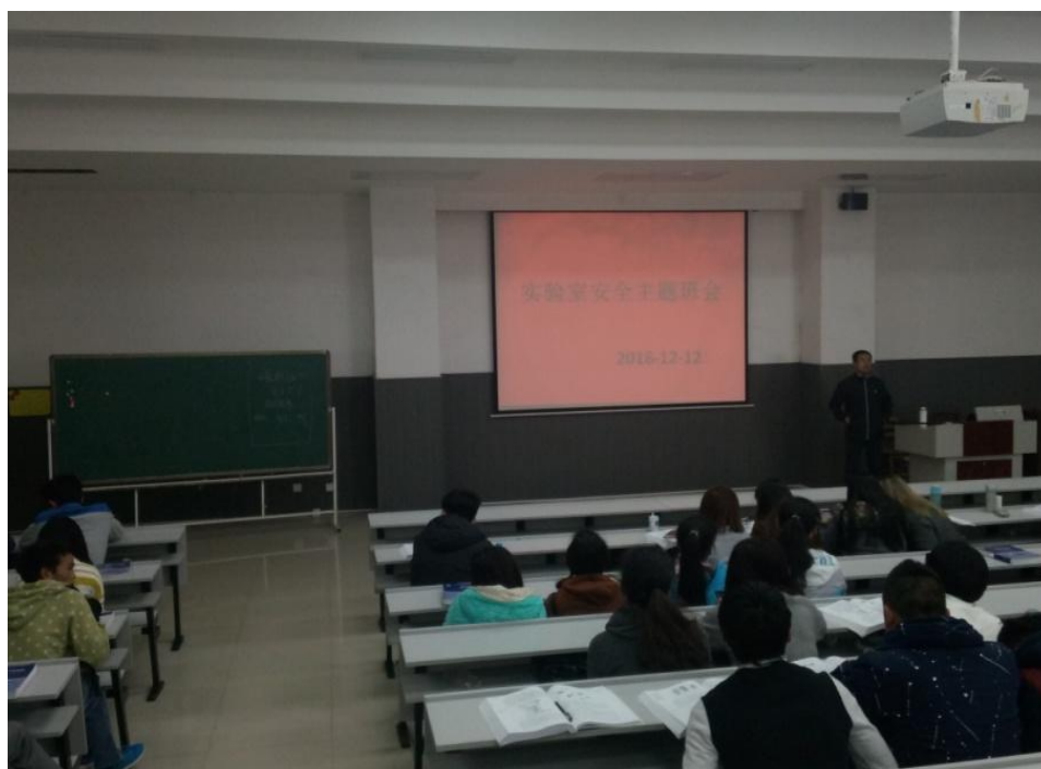
14 级生物本 1、2 班班会现场