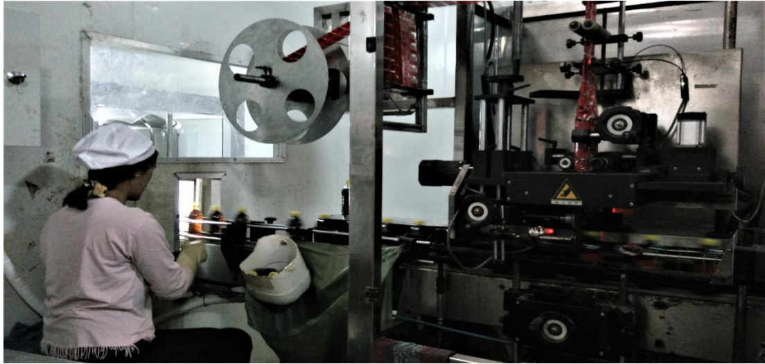
饮料装瓶或者装罐，又再装箱。